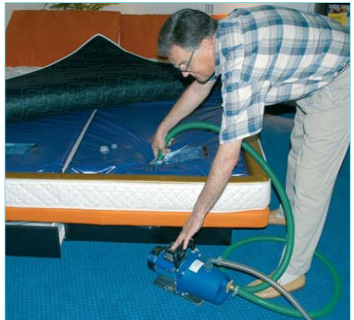
Mit Hilfe einer Spezialpumpe wird das Wasserbett entleert. Am neuen Standort wird das Bett wieder installiert und die Matratze wieder mit Wasser gefüllt.