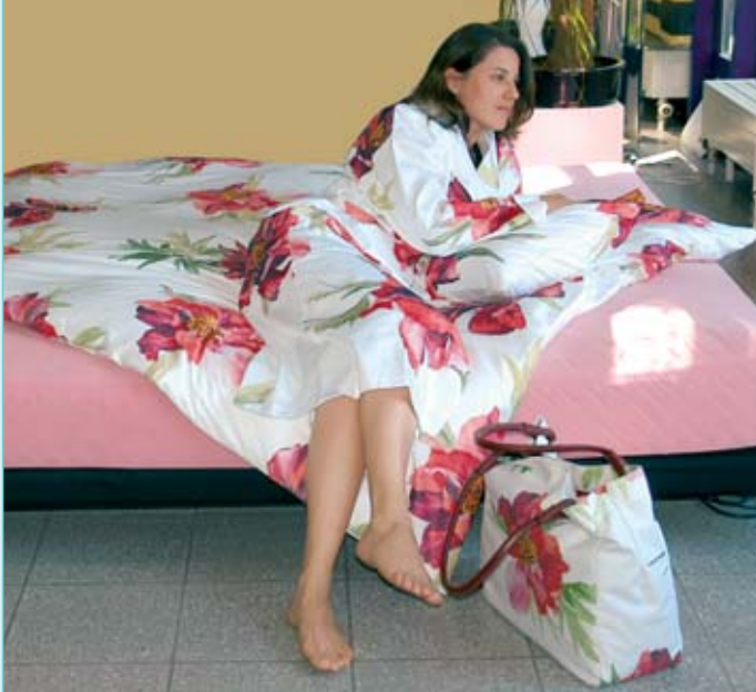
Aus den wunderschönen Stoffen können Sie sich neben Duvet- und Kissenanzügen auch Morgenmäntel, Taschen und andere Accessoires herstellen lassen.

Egal, ob Sie modernes Design, rustikale Gemütlichkeit oder verspielte Romantik bevorzugen – mit dem richtigen Bettwäsche-Dessin schaffen Sie im Handumdrehen das Ihnen zusagende Ambiente im Schlafzimmer.