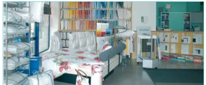
Bei uns finden Sie eine grosse Auswahl an Duvets, Kissen und Pfulmen mit verschiedenen Füllungen sowie die passende Bettwäsche der bekanntesten Marken.