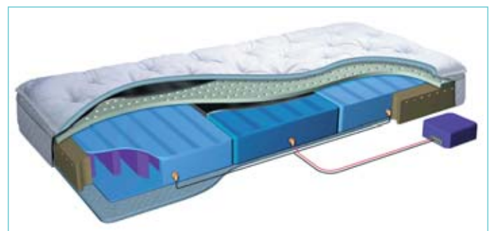
air bed 2000

Es wäre jetzt einfach zu sagen, es gäbe – zumindest bei unseren Systemen – keine Nachteile. Es kommt immer darauf an, was man als Nachteil betrachtet. Beim Wasserbett ist vielleicht der Nachteil, dass man ein komplettes Bett kaufen muss, während man sowohl beim Luftbett wie bei der Tempur-Matratze als Unterbau einen bestehenden Lättlicouch bzw. einen Lättlirost verwenden kann und somit nur die Matratze kauft. Als Nachteil