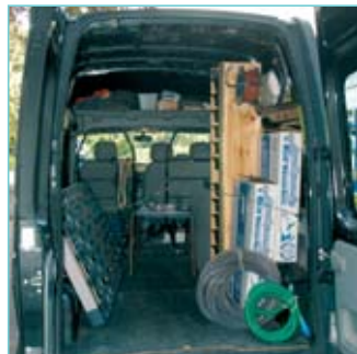
Das Innere des Transporters enthält eine komplette Servicewerkstatt.