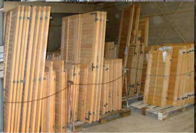
Holz-Fensterläden nach der Behandlung