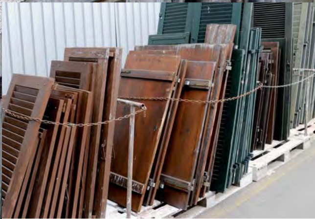
Holz-Fensterläden vor der Behandlung